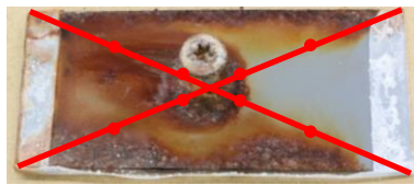
図 3-2 ドリルねじ周辺が円形に腐食した試験体の外観写真