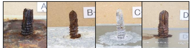
図3-1 各鋼板におけるドリルねじbの外観写真

ドリルねじdはいずれの鋼板に対しても、腐食減量は5%未満であり、優れた耐食性を示した。このことから耐食性の高い外壁用のドリルねじとしては、ドリルねじdとするのが良いと言える。