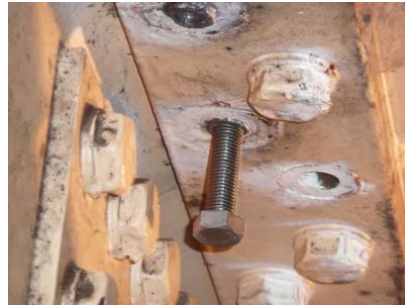
⑤逆ねじボルト挿入