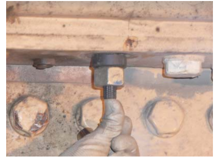
⑨片側施工用高力ボルトの挿入