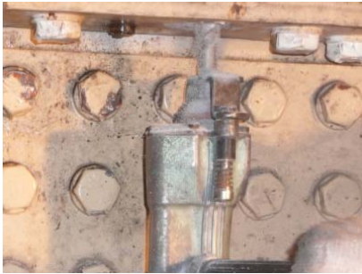
⑦RC 床版の穴あけ切削