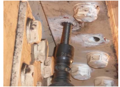
⑥インパクトレンチでねじ部排出