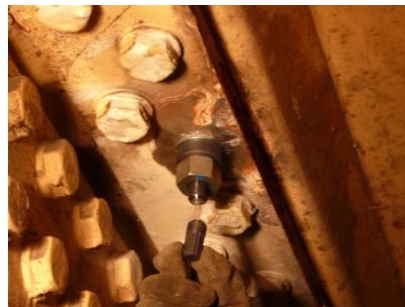
⑪片側施工用高力ボルト締結完了