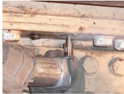
⑧RC 床版の径拡大切削