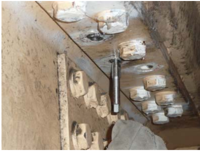
④逆ねじタップ切り