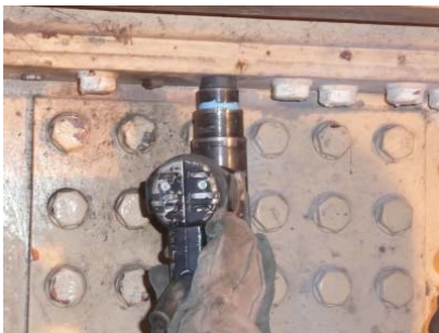
⑩片側施工用高力ボルトの締結